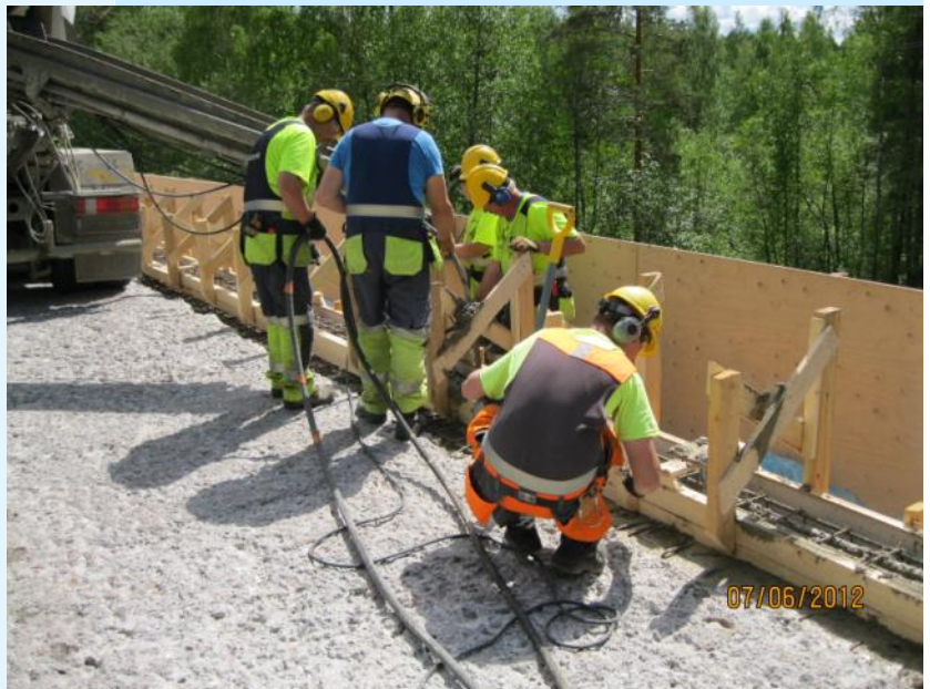
Kannen reunapalkin betonointityö käynnissä