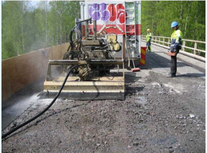
Sillan vanhan kannen yläpinnan purkaminen vesipiikkausrobotilla

Näillä kyseisillä sillankorjaustoimenpiteillä saadaan jatkettua sillan elinkaarta ainakin 30 vuotta ja varmistetaan sillan toimivuus ja kantavuus vastaamaan tulevaisuuden liikenteen määriä.